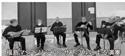
福島マンドリンアンサンブルによる演奏