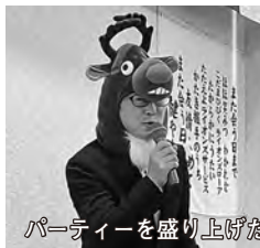
パーティーを盛り上げた総務委員長と親睦委員長

来年も福島中央LC会員皆が、健康で仲良く活動していけることを願い、最後はライオンズ・ローアで締めくくりました!(L吉田)