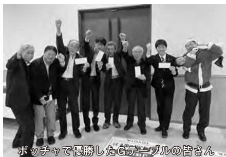
ボッチャで優勝したGテーブルの皆さん