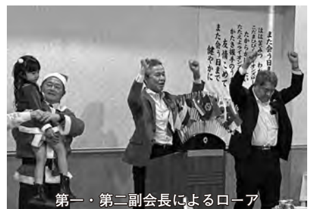
第一・第二副会長によるローア