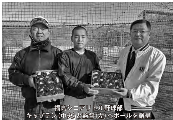
福島シニアリトル野球部 キャプテン(中央)と監督(左)へボールを贈呈

主催であります日東紡績株式会社所属の浅見監督様が指導されてますチームです。将来、大谷翔平選手のようなスーパースターが福島から出ることを祈ります。(L加藤)