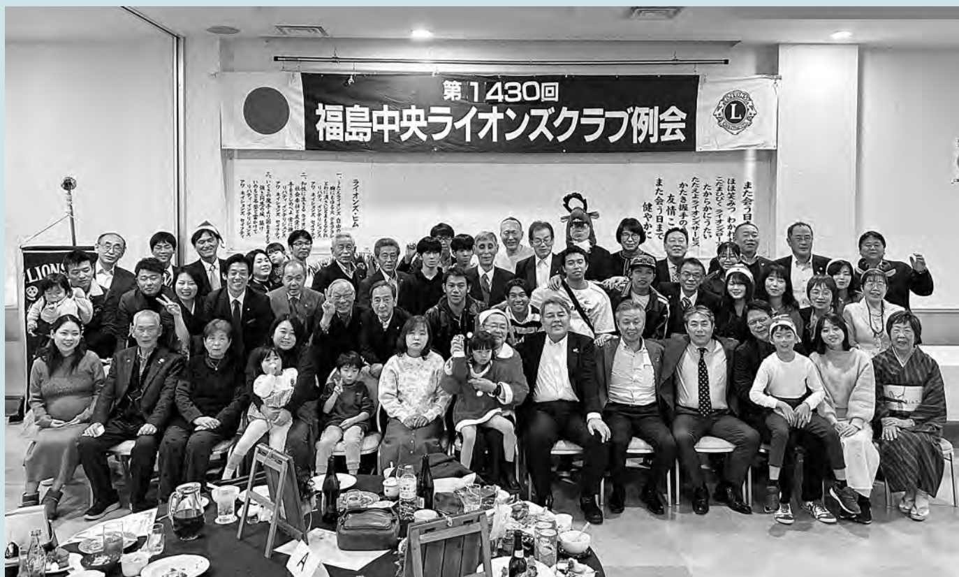
親睦クリスマスパーティー