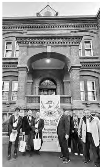
OSEALフォーラム会場前にて