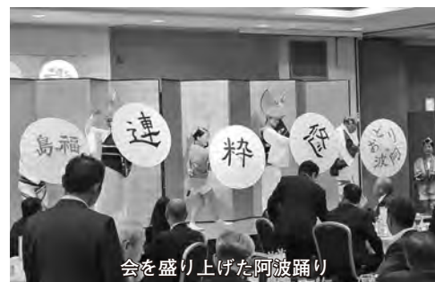
会を盛り上げた阿波踊り