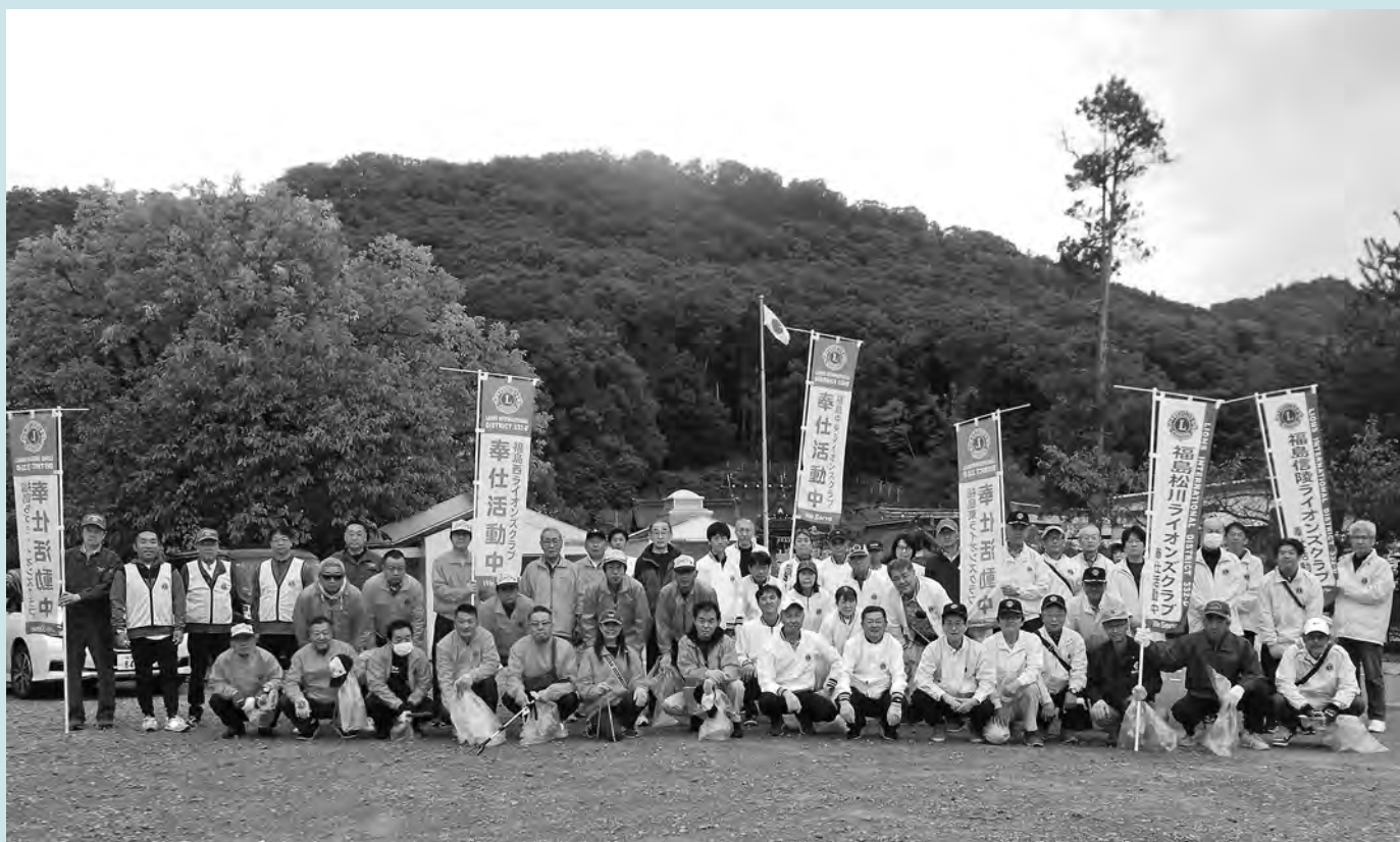
第2 R第1 Z 6 LC合同アクティビティ並びに福島縣護國神社周辺清掃