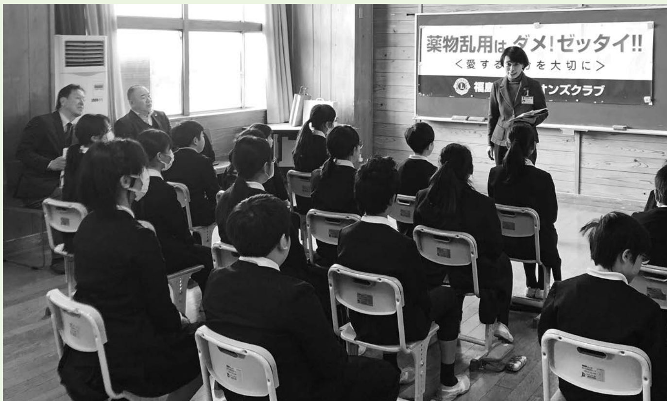
福島市立第二小学校で行われた薬物乱用防止教室