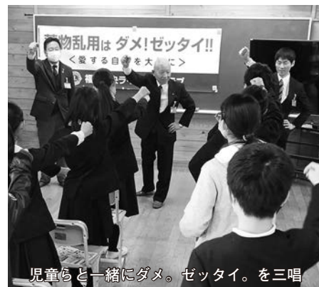
児童らと一緒にダメ。ゼッタイ。を三唱