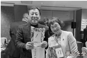
景品を受け取る会員ら