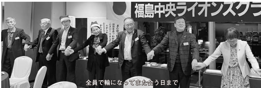
全員で輪になってまた会う日まで