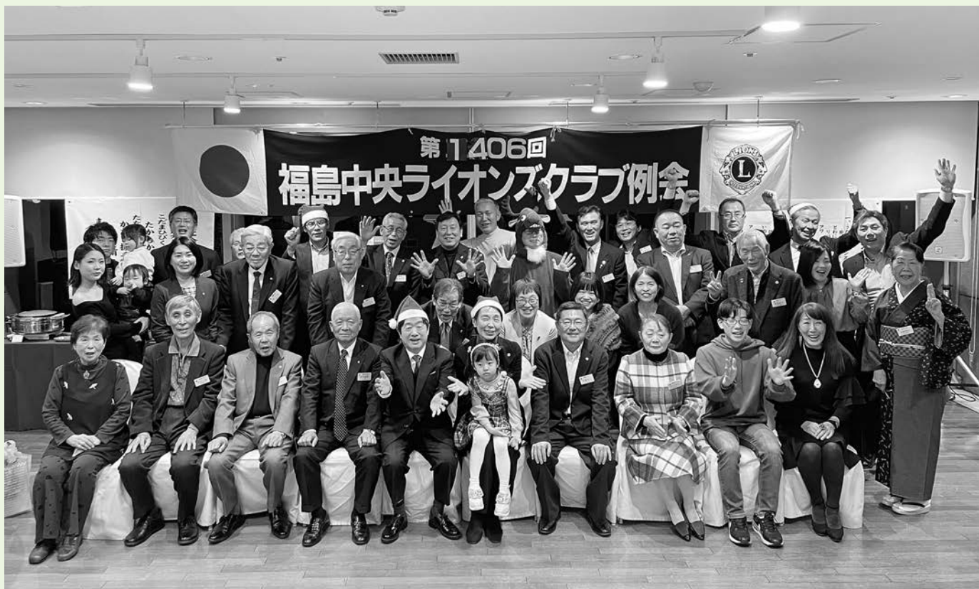
親睦クリスマスパーティー