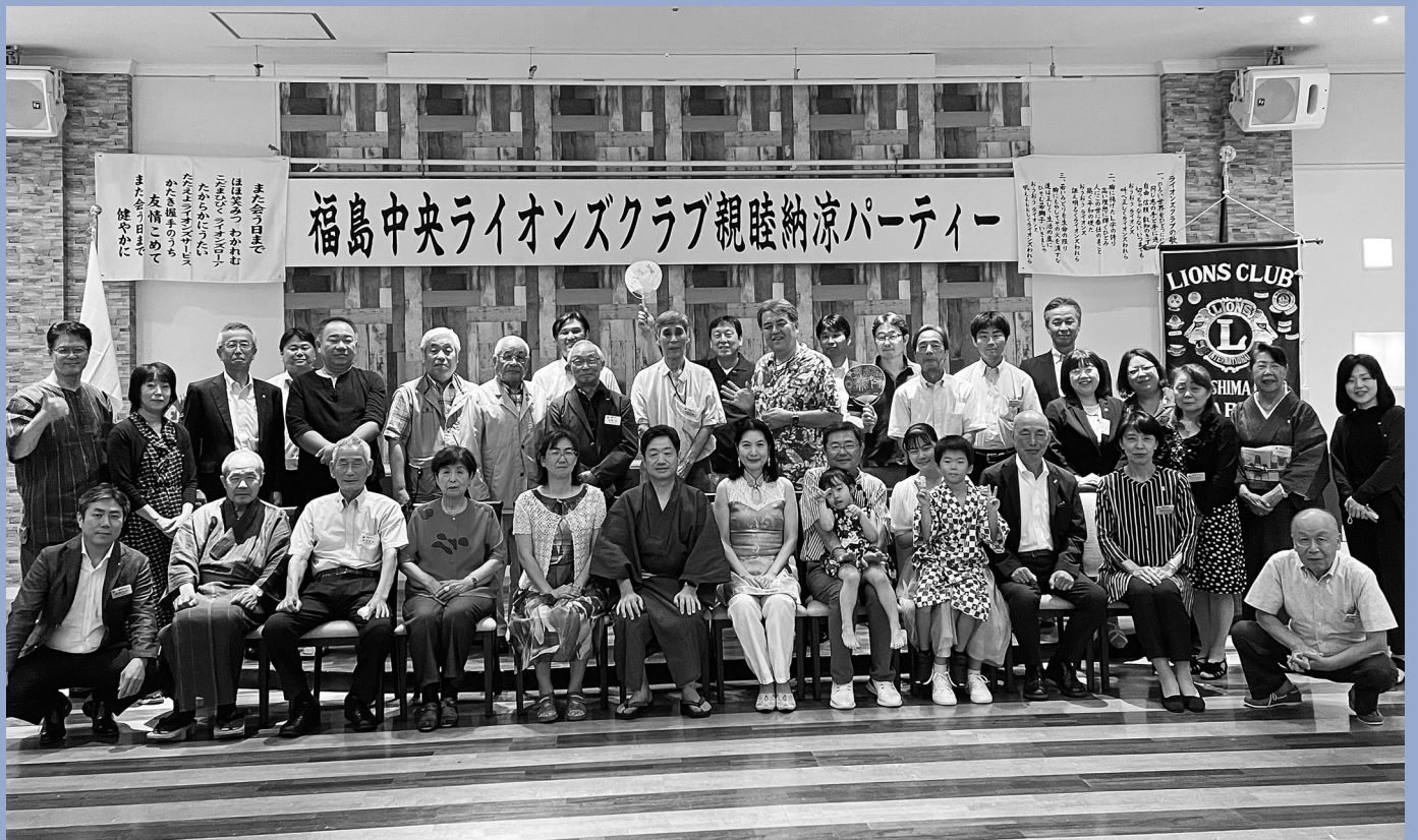
親睦納涼パーティーを楽しんだ会員ら