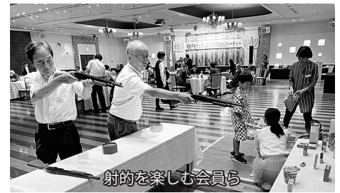
射的を楽しむ会員ら