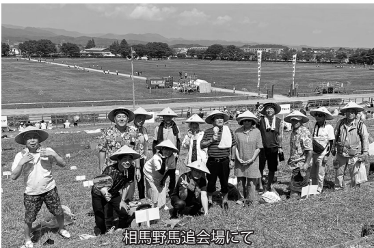
相馬野馬追会場にて