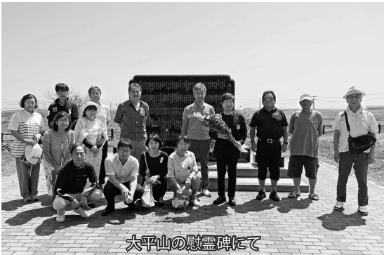
大平山の慰霊碑にて

近年の温暖化により、相馬野馬追の開催時期を検討しているとの事です、暑さと和らぐ時期に変更した際には、また見学に行きたいですね。(L齋藤和)